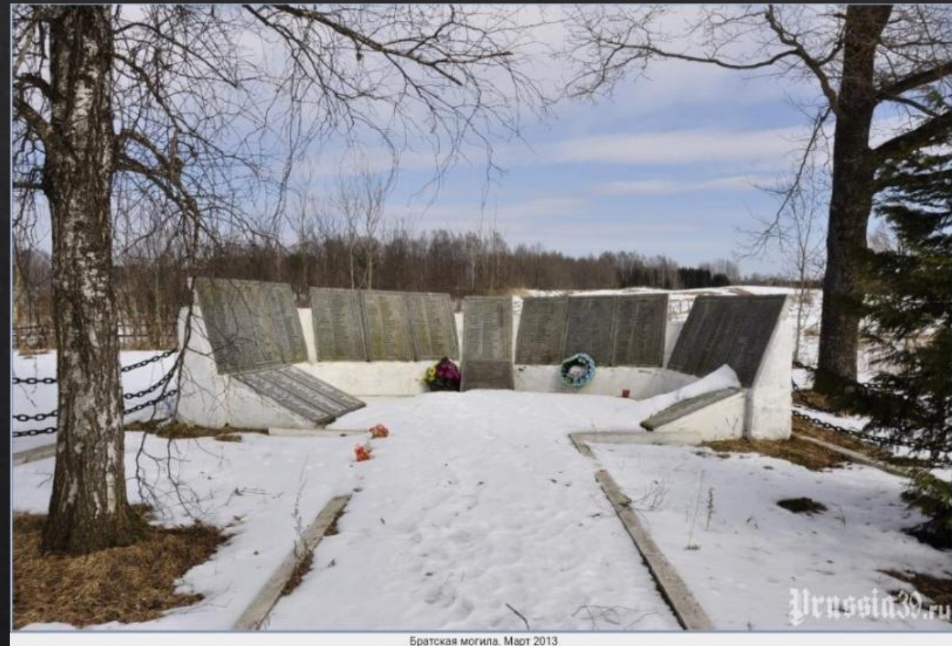
Братская могила. Март 2013