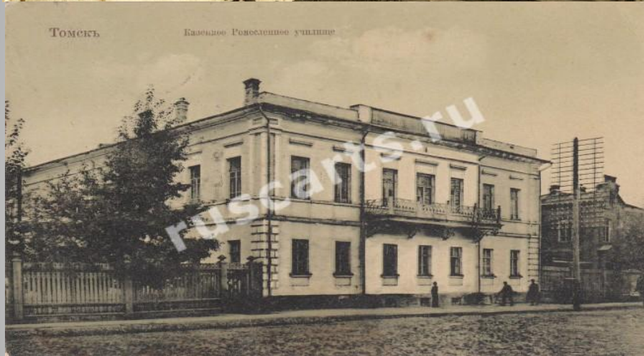
Кавенное Ремесленное училище